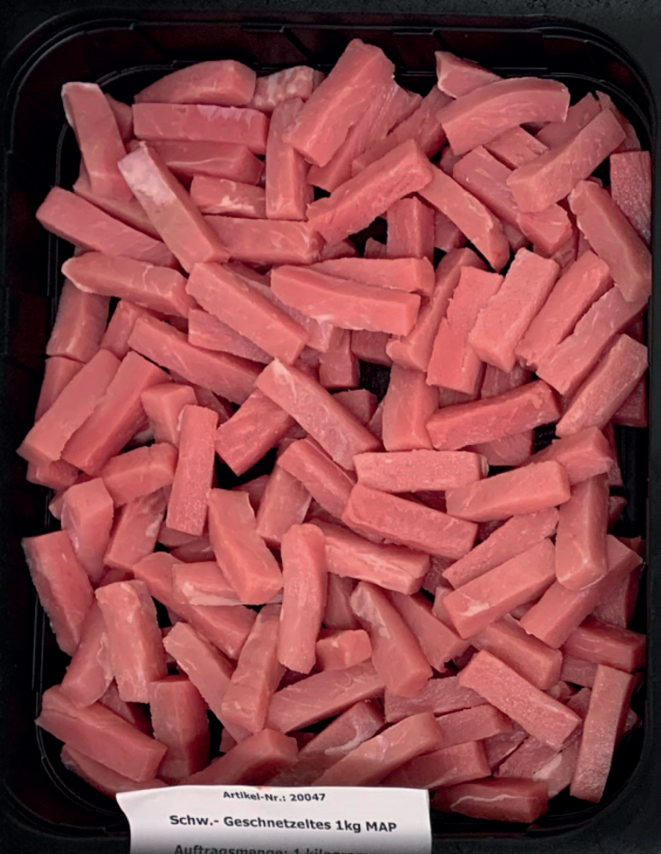
Artikel-Nr.: 20047 Schw.- Geschnetzeltes 1kg MAP Auftragsmenge: 1 Kilogramm