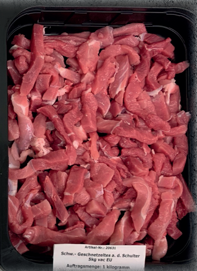
Artikel-Nr.: 20631 Schw.- Geschnetzeltes a. d. Schulter 5kg vac EU Auftragsmenge: 1 Kilogramm