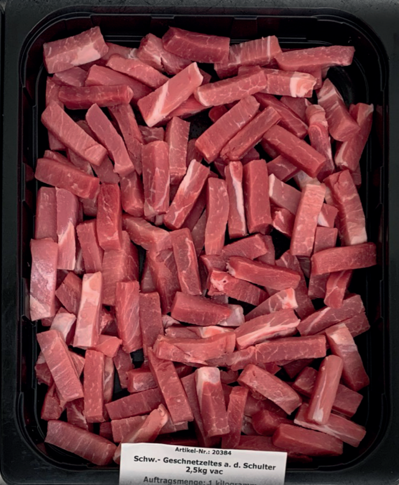
Artikel-Nr.: 20384 Schw.- Geschnetzeltes a. d. Schulter 2,5kg vac Auftragsmenge: 1 Kilogramm